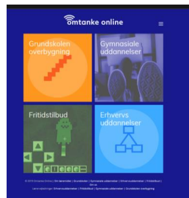
Figur 3-1: Screenshot af omtankeonline.dk

Der er fire tværgående temaer på Omtanke Online: